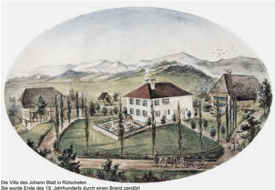
Die Villa des Johann Blatt in Rütshelen Sie wurde Ende des 19. Jahrhunderts durch einen Brand zerstört